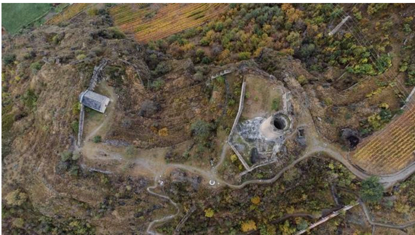
Vista dall'alto, Antica Fortezza Châtel-Argent a Villeneuve in Valle D'Aosta.

La risposta a questa domanda è nelle mani degli architetti e degli studenti che parteciperanno a questa competizione.